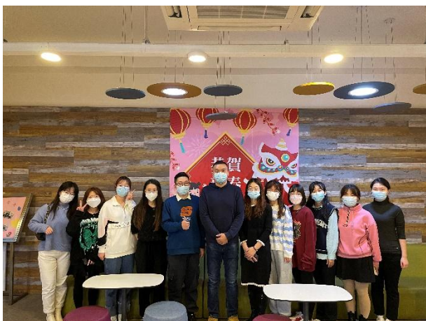
宁夏医科大学赴澳科大交流生心得分享会