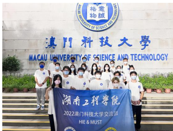
湖南工程学院赴澳科大交流生合影