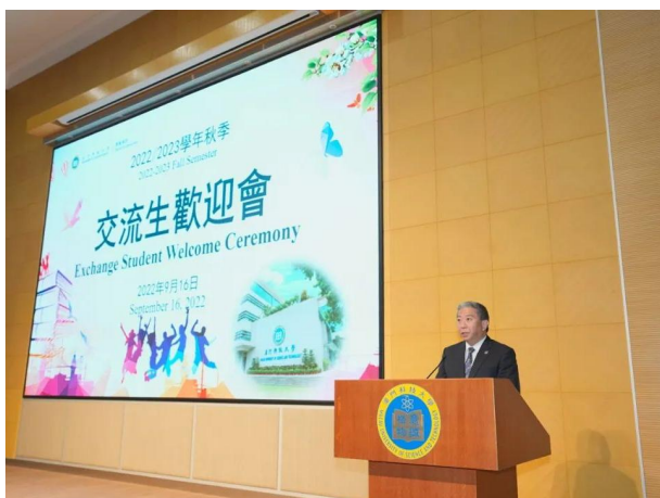
澳科大 2022 秋季学期交流生欢迎会