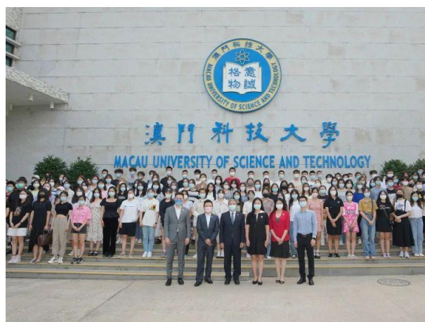
澳科大 2022 秋季学期交流生合影