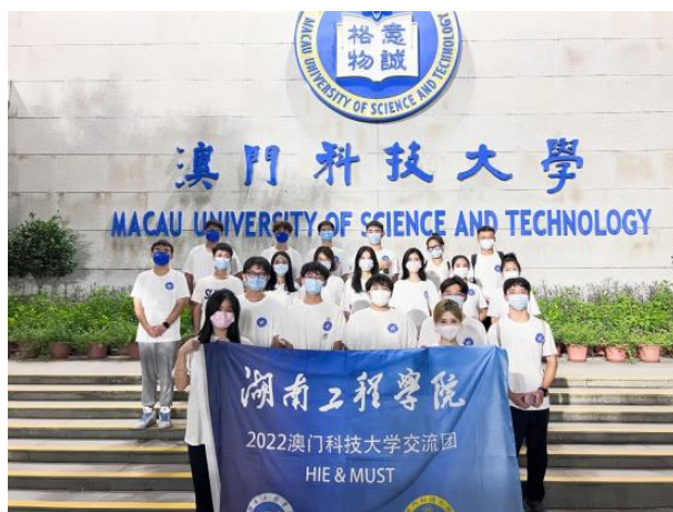
湖南工程学院赴澳科大交流生合影