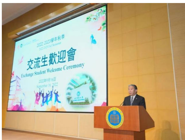
澳科大 2022 秋季学期交流生欢迎会