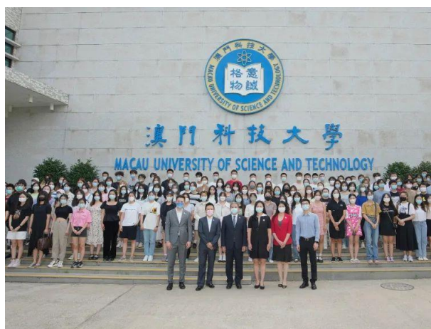
澳科大 2022 秋季学期交流生合影