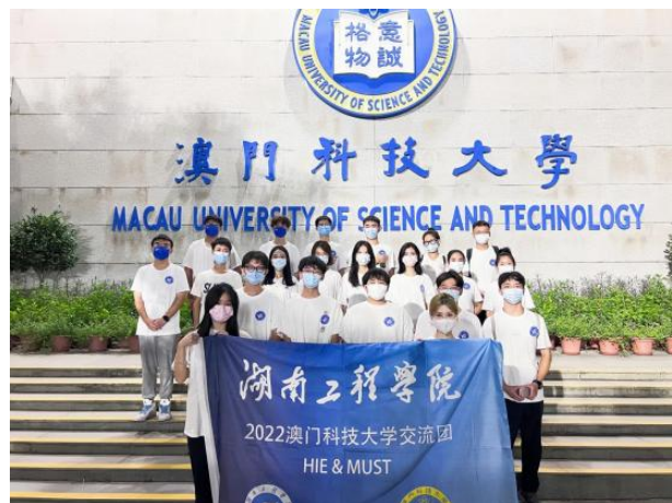
湖南工程学院赴澳科大交流生合影