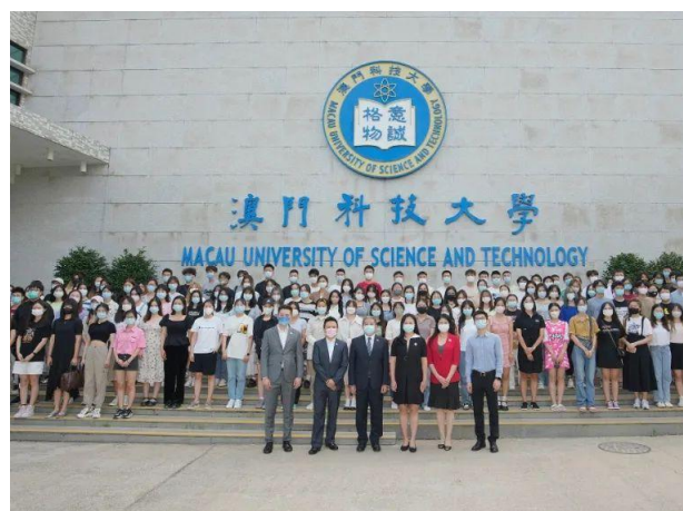
澳科大 2022 秋季学期交流生合影